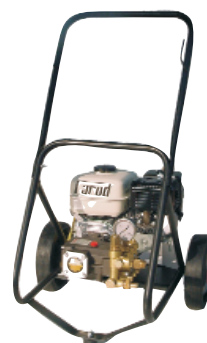
AUT-1410 a 2015