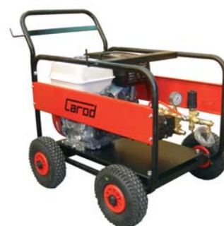
AUT-2030 a AUT-1250