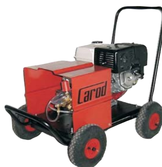
AUT-5045 a 2513