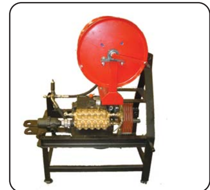
Enrollador no incluido